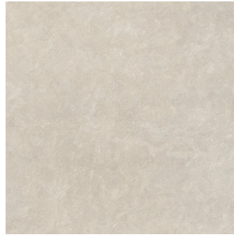
TOGA TAUPE P1212L