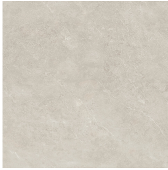
ANTI-SLIP TOGA TAUPE RECTIFICADO P1212R