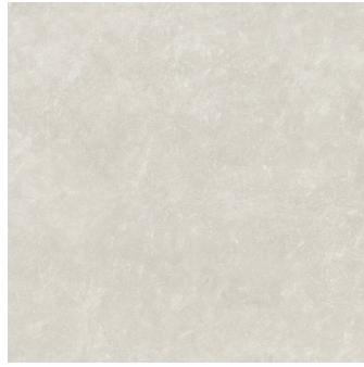
TOGA GREY P1212L