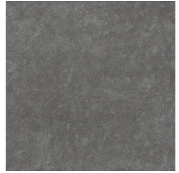
TOGA BLACK P1212E