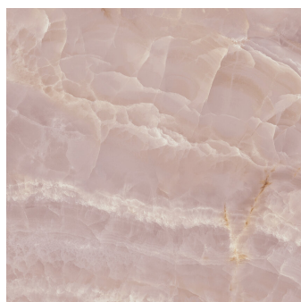
SAPHIRE ROSE PULIDO P1212GRP