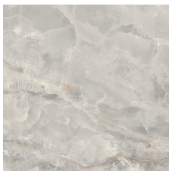
SAPHIRE NACRE PULIDO P1212GRP