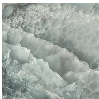
SAPHIRE JADE PULIDO P1212GRP