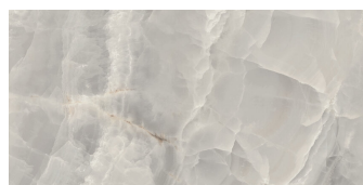
SAPHIRE NACRE PULIDO P6012GRP