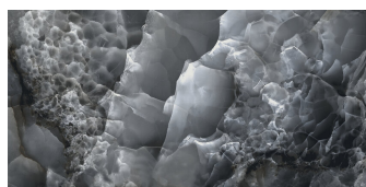
SAPHIRE NUIT PULIDO P6012GRP