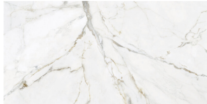
RAVENA PULIDO P6012P