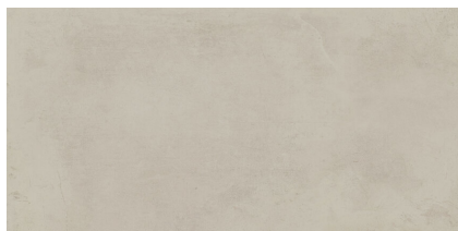
LOUNGE SAND P6012L