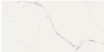
FINEZZA BIANCO PULIDO P6012P