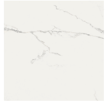
FINEZZA BIANCO PULIDO P1212V