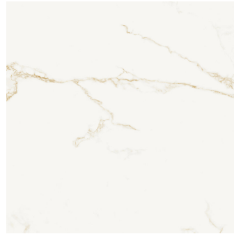
FINEZZA ORO NATURAL P1212L