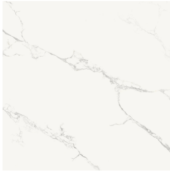
FINEZZA BIANCO NATURAL P1212L