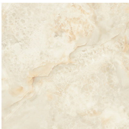
ARAL CREAM PULIDO P1212P